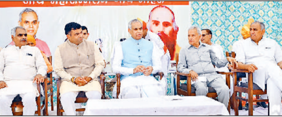
सोनीपत। कार्यक्रम के दौरान मंचासीन राज्यपाल आचार्य देवव्रत एवं अन्य गणमान्य

को समाप्त कर हिंदू धर्म की व्यवस्था को सुदृढ़ बनाने में अहम भूमिका निभाई। उन्होंने बताया कि स्वामी दयानंद सरस्वती के विचारों से प्रेरित होकर मुंशीराम, जो बाद में स्वामी श्रद्धानंद के नाम से प्रसिद्ध हुए, ने हरिद्वार में गुरुकुल कांगड़ी की स्थापना करके गांव-गांव तक आर्य समाज के विचारों का प्रचार-प्रसार किया। उन्होंने हिंदू समाज में फैली कुरीतियों को दूर कर एक स्वच्छ और जागरूक समाज के निर्माण में योगदान दिया। वहीं भगत फूल सिंह की जयंती के अवसर पर उन्होंने कहा कि भगत फूल सिंह प्रारंभ में एक पटवारी थे, आर्य समाज की शिक्षाओं से प्रभावित होकर उन्होंने गुरुकुल खानपुर की स्थापना की और विशेष रूप से महिला शिक्षा को बढ़ावा देने में महत्वपूर्ण योगदान दिया।