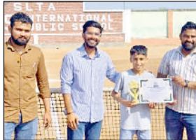
गोहाना। अकादमी में खिलाड़ी ओजस को सम्मानित करते हुए।