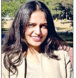
पहले प्रयास में प्री क्लीयर न होने पर हिम्मत नहीं हारी, प्रतिदिन आठ घंटे की पढ़ाई