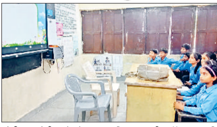
सोनीपत। सोनीपत के सेक्टर-15 स्थित राजकीय मॉडल संस्कृत प्राथमिक विद्यालय में डिजिटल बोर्ड से पढ़ाई करते विद्यार्थी।