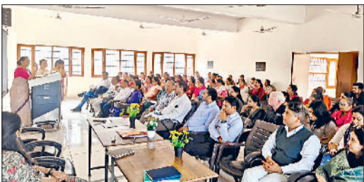
सोनीपत। कार्यक्रम के दौरान उपस्थित शिक्षक एवं अन्य।

▶▶ हर विद्यार्थी का आकलन सहज शांत वातावरण में खड़े करके नहीं बरखर में बैठकर करना होगा। ▶▶ हर आकलन पूरा होने के बाद घण्टे के बाद घण्टे पर सेव व एंड असेसमेंट पर तिलक करना होगा। ▶▶ कक्षाओं से संबंधित शिक्षक के लॉग इन आइडी से ही लागिन या लॉग-आउट किया जाएगा। ▶▶ आकलन के दौरान कक्षा शिक्षक या प्रधानाचार्य बच्चों से बातचीत नहीं करेंगे। ▶▶ समस्या पर जिला समन्वयक एफएलएन को सूचित करेंगे।