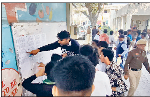
सोनीपत। मुरखल अह्ला पर बने परीक्षा केंद्र के प्रवेश द्वार पर चप्पा सूची में अपना रोल नंबर देखते विद्यार्थी।

जिला में हरियाणा विद्यालय शिक्षा बोर्ड (एचबीएसई) व केंद्रीय माध्यमिक शिक्षा बोर्ड (सीबीएसई) की कक्षा 10वीं व 12वीं की बोर्ड परीक्षाओं का दौर जारी है। एचबीएसई की ओर से बनाए गए 67 केंद्रों पर शुक्रवार को कक्षा 12वीं के पंजीकृत 8586 विद्यार्थियों में से 8443 ने इतिहास व जीव विज्ञान विषय का पेपर दिया, जबकि 143 विद्यार्थी अनुपस्थित रहे। परीक्षा के दौरान गोहाना के गांव कटवाल में बने परीक्षा केंद्र के बाहर नकल कराने का एक हाई-प्रोफाइल मामला सामने आया। बोर्ड चेयरमैन के स्पेशल आरएफ (उड़नदस्ता) टीम ने तीन शिक्षिकाओं को मौके पर पंचियों बनाते पकड़ा। बोर्ड के अधिकारियों की ओर से केंद्र अधीक्षक को कार्रवाई आदेश दिए गए। इसके अलावा जिले के सभी केंद्रों पर शांतिपूर्ण माहौल में विद्यार्थियों ने परीक्षा दी। वहीं सीबीएसई की ओर से बने केंद्रों पर कक्षा 10वीं की पॉपिंग व 12वीं की पंजाबी विषय पर परीक्षा हुई।