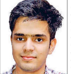
सेल्फ स्टडी से मिली बड़ी कामयाबी, बड़ी बहन का मार्गदर्शन काम आया