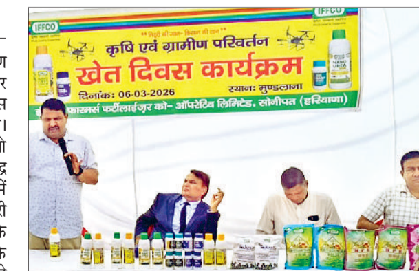
गोहाना। किसानों को नैनो उर्वरकों के फायदे बताते हुए विशेषज्ञ।